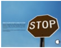
Campaña - Alto Arizona USA Hispano